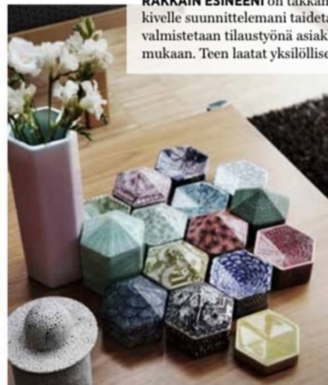
koti ja keittiö

RAKKAIN ESINEENI on takkamme, joka on Tulikivelle suunnittelemani taidetikka. Kaikki takat valmistetaan tilaustyönä asiakkaan toiveiden mukaan. Teen laatat yksilöllisesti käsin.